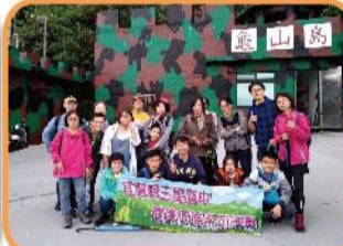
108文康活動-龜山島之行