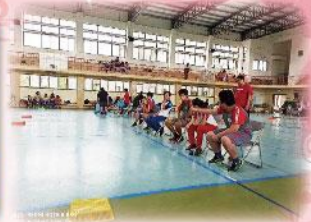
宜蘭縣地板滾球競賽