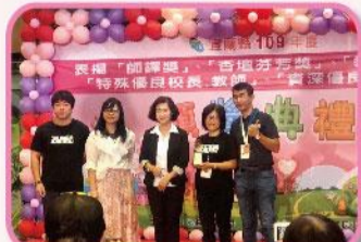
本校獲教育部教學卓越獎