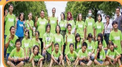
夏日樂學-土耳其文化交流