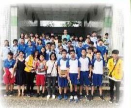
八年級社區高職參訪-羅東高商