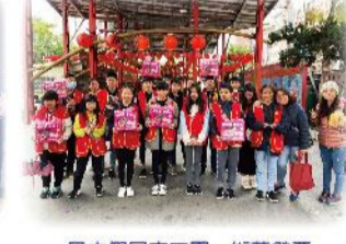
星中假日志工團-街募發票