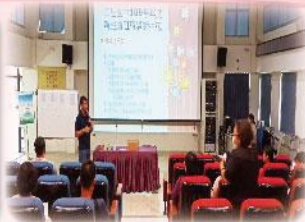
新生編班暨導師抽籤