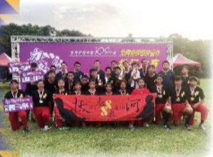
109教育部室外拔河錦標賽