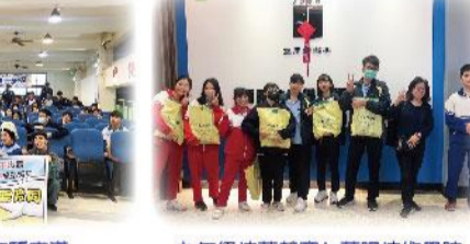
九年級技藝競賽 in 蘭陽技術學院