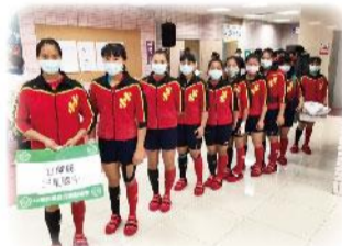
108學年度全國拔河錦標賽