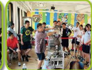
九年級會考後活動-地熱米民望農村體驗