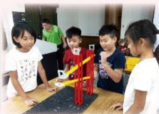
機關王-子軌道實作營隊