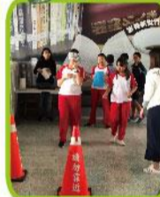
61週年校慶-生命教育體驗開幕