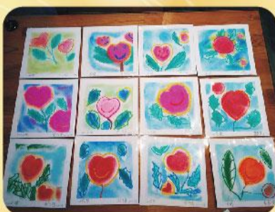
心靈成長~日本和諧粉彩畫