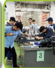
九年技藝教育-一羅工機核合作班