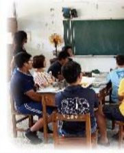
台灣生態登山學校-亞成鳥心得分享會