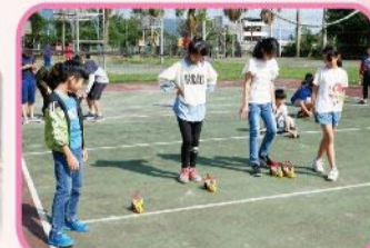
太陽能板車實作營隊