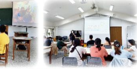
生命教育中心學校-教師增能工作坊