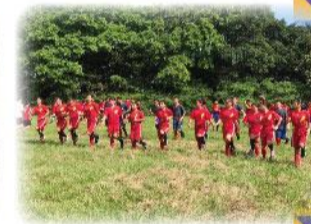
108教育部室外拔河錦標賽