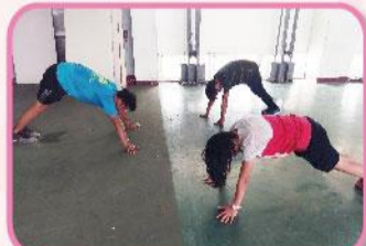
109年度教育部學產基金培訓弱勢學生計畫