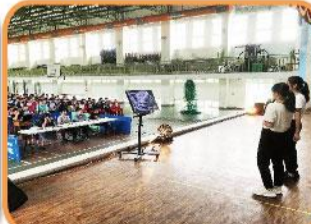
校慶-星中盃k歌大賽