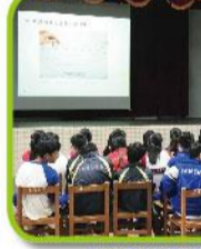
八年級職業達人講座