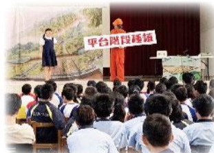
109水土保持酷學校宣導