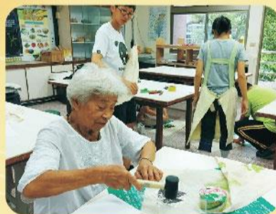
在地美感藝術創作