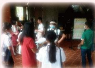
參加本縣語文競賽