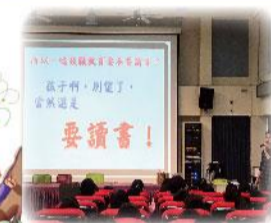
七年級藝文教育宣導