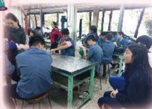
羅東高工轉銜參訪