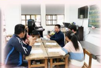
藝術與人文教學深耕計畫備課研習會議