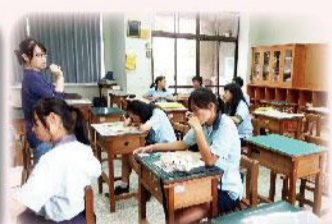
師生閱讀寫作營隊