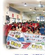
勞工局-求職防詐騙宣導