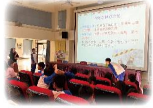
七年級性別平等教育宣導