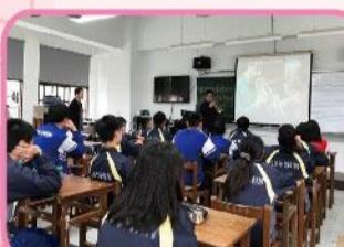
藝術與人文計畫協同教學