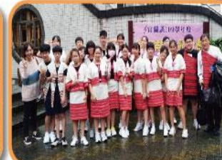
109宜蘭縣學生音樂比賽