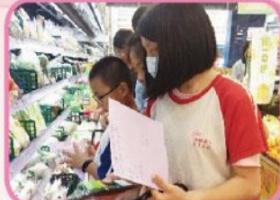
108學年度身心障礙課後照顧平假日班