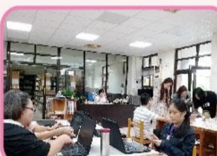
行動載具教學應用研習