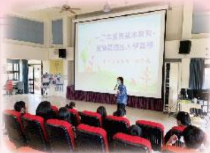
十二年國民基本教育-適性入學宣導