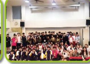
九年級升學宣導-台北市莊敬高職